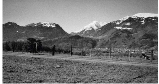
BLICK NACH SÜDEN AUF BAD RAGAZ, MUNTALUNA, TAMINATAL

ALS EBENSO VORAUSBLICKEND MUSS AUCH MALTES ERHÖHTE BEACHTUNG VON GERÄUSCHEN UND KLÄNGEN GELTEN, DIE RILKES BETONTES UNVERHÄLTNISS ZUR MUSIK KOMPENSIERT, BEVOR IN DEN KOMPOSITIONEN DES 20. JAHRHUNDERTS GERÄUSCHE UND STILLE ERLEBBAR EINBEZOGEN WURDEN, UND WO WURDE VORHER IN DER LITERATUR DAS UNSICHTBARE DING „BLECHBÜCHSE“ EIN THEMA? WO WURDE DEM GERÄUSCH, DAS EINE BLECHERNE BÜCHSE ERZEUGT, WENN SIE IM ZIMMER DES NACHBARS AUF DEN BODEN KULLERT UND WEGROLLT, SO VIEL AUF-